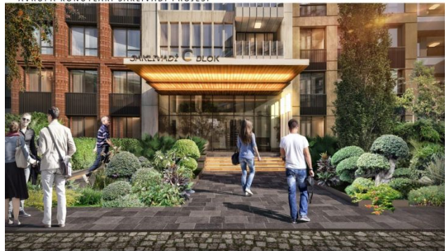
AVRUPA KONUTLARI SAKLIVADI PROJESİ