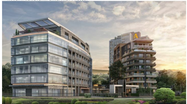
AVRUPA KONUTLARI SAKLIVADI PROJESİ