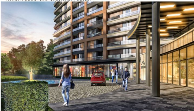
AVRUPA KONUTLARI SAKLIVADI PROJESİ