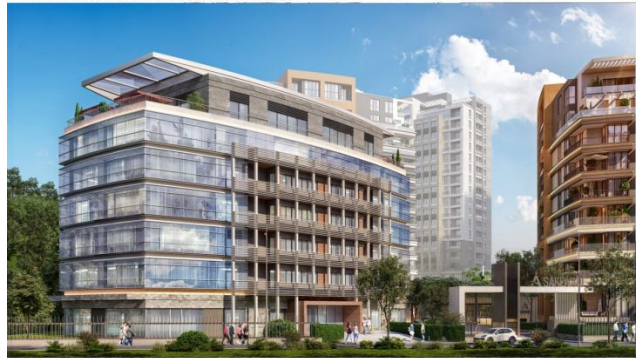
AVRUPA KONUTLARI SAKLIVADI PROJESİ