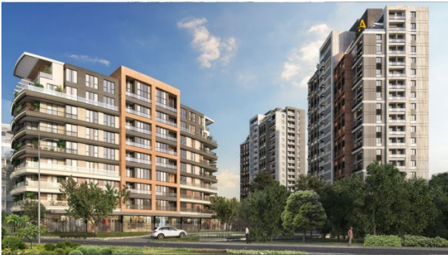
AVRUPA KONUTLARI SAKLIVADI PROJESİ