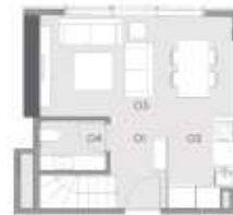
1+1 C KAT