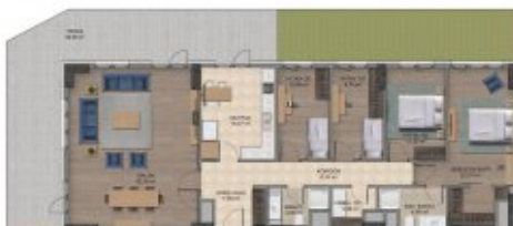
Karden İnşaat A.Ş.'nin proje tadilat yapma hakkı saklıdır. Katilof broşür,ilan,maklet gibi görseller ile örnek daire uygulamaları fikir verme amaçlı olup kesinlik içermez.