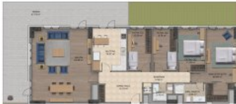
Karden İnşaat A.Ş.'nin proje tadilat yapma hakkı saklıdır. Katilof broşür,ilan,maklet gibi görseller ile örnek daire uygulamaları fikir verme amaçlı olup kesinlik içermez.