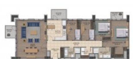
Karden İnşaat A.Ş.'nin proje tadilat yapma hakkı saklıdır. Katilof broşür,ilan,maklet gibi görseller ile örnek daire uygulamaları fikir verme amaçlı olup kesinlik içermez.