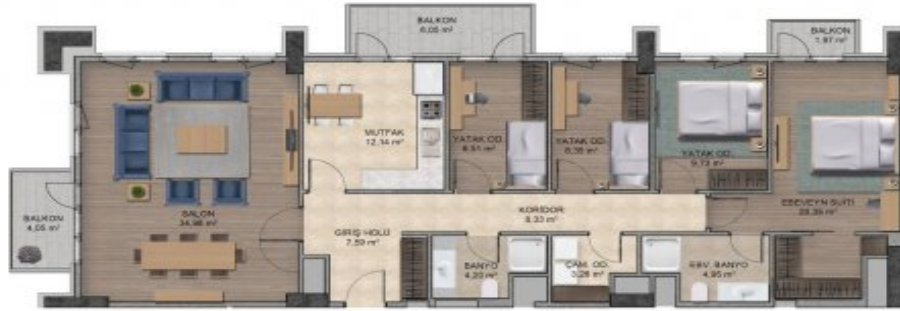
Karden İnşaat A.Ş.'nin proje tadilat yapma hakkı saklıdır. Katilof broşür,ilan,maklet gibi görseller ile örnek daire uygulamaları fikir verme amaçlı olup kesinlik içermez.